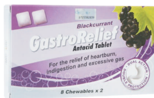
Gastro Relief Antacid Melegakan gastrik dan kembung perut