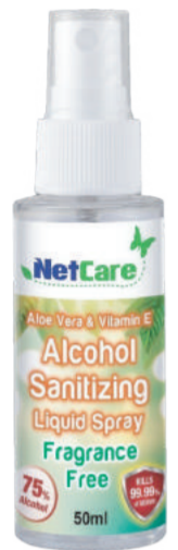
Netscare Alcohol Sanitizing Spray Untuk kebersihan tangan