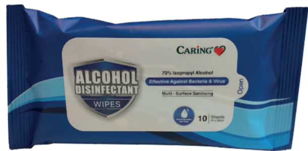
CARiNG Alcohol Disinfectant Wipes Membasmi kuman pada permukaan