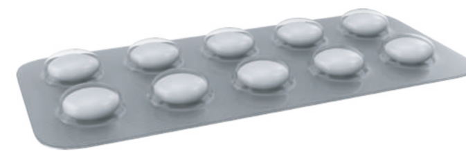
Paracetamol Mengubati demam dan sakit-sakit badan