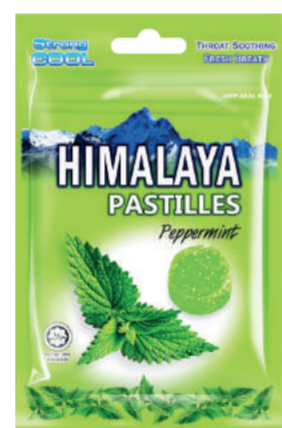
Himalaya Pastilles Peppermint Membantu mengurangkan sakit tekak