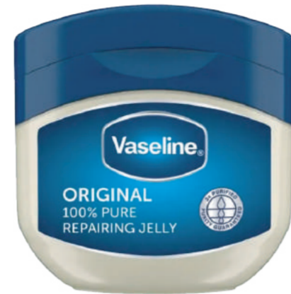
Vaseline Petroleum Jelly Pelembap bibir dan kulit