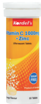
Vitamin C 10s Tablet Meningkatkan imuniti badan