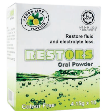
Restors Oral Powder Penghidratan semula oral untuk cirit birit