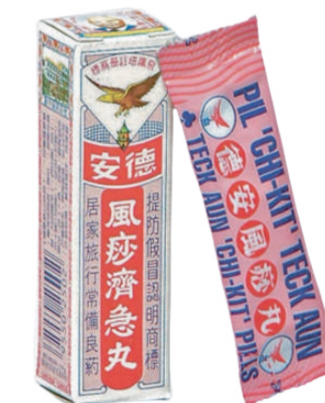
Chi Kit Teck Aun Untuk sakit perut, cirit-birit dan muntah-muntah