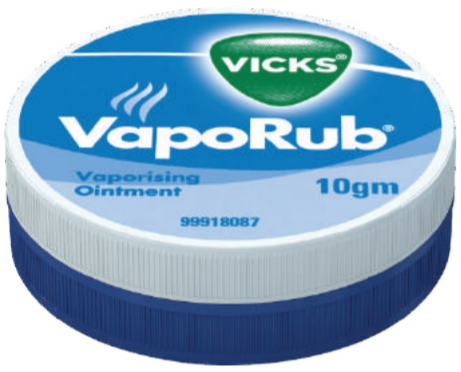
Vicks Vaporub Mengubati selesema